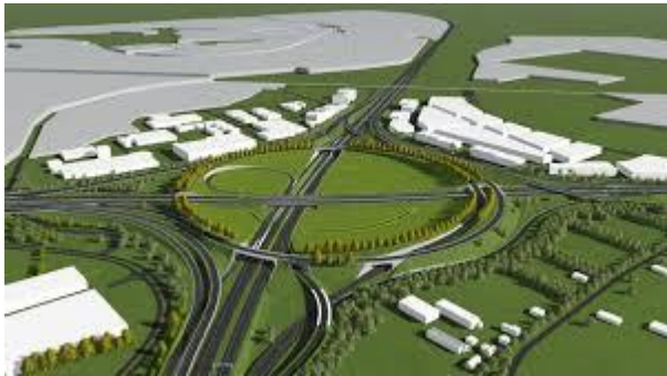
Netwerkvisie regio FoodValley