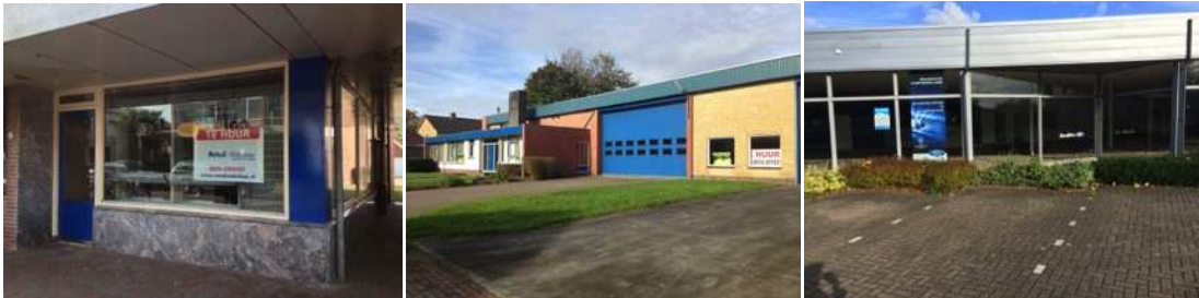
Enkele leegstaande panden in Buitenpost.

Ja, er is sprake van leegstand waarbij het niet gaat om hoge absolute aantallen, maar er toch een aanzienlijk gedeelte commercieel vastgoed leeg staat. Dit heeft vooral effect op de beleving van het winkelgebied: het winkelgebied voelt niet 'af' en is niet optimaal levendig. Ook hebben sommige middenstanders moeite om hun onderneming overeind te houden. Toch heeft Buitenpost (naast een sterke boodschappenfunctie) een divers winkelaanbod met speciaalzaken in een compact centrum, kent het dorp betrokken ondernemers en heeft het met Bruisend Buitenpost een gedreven platform dat in potentie veel kan bijdragen aan een sterke een dynamische plaatselijke economie.