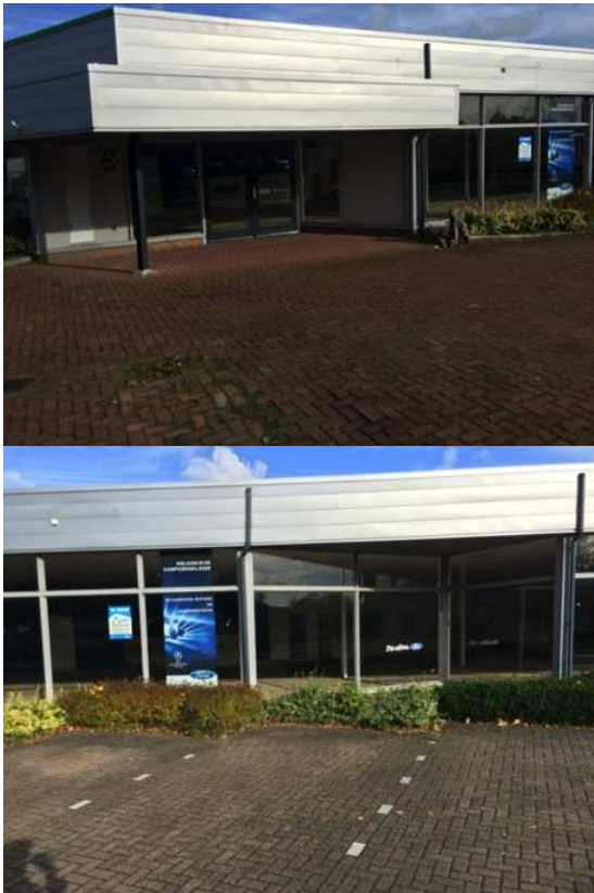
Leegstaande voormalige Fordgarage bij het station. Een prachtige zichtlocatie, zowel door de enorme glazen pui als door de zichtbaarheid vanuit de trein.