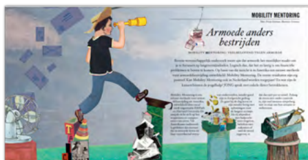
Magazine Jong: Armoede anders bestrijden