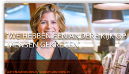
Magazine 'Trots op je vak': interview