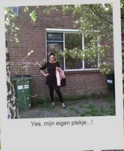
Yes, mijn eigen plekje...!